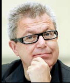
Daniel Libeskind (63), Architekt

ARCHITEKT DANIEL LIBESKIND ÜBER SEIN KONZEPT ZUR AUSEINANDERSETZUNG MIT DER MILITÄRGESCHICHTE.