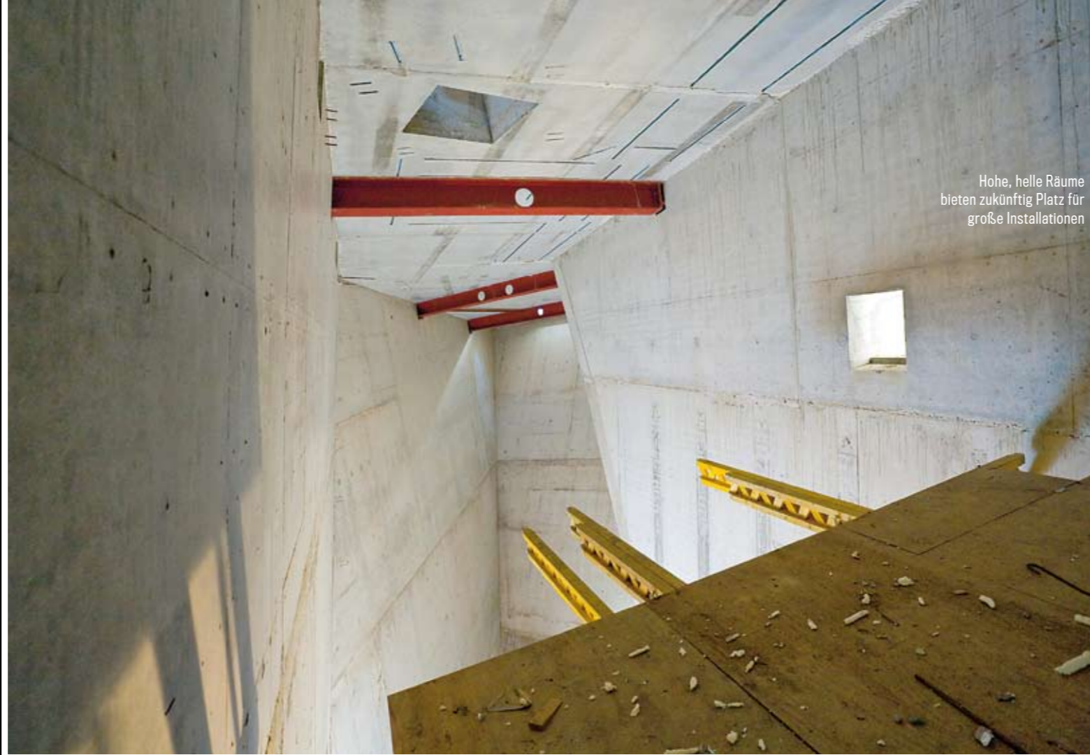
Hohe, helle Räume bieten zukünftig Platz für große Installationen

Warum glauben Sie, ist die Beschäftigung mit Gewalt für ein Museum der Bundeswehr notwendig? Der Neubau schneidet einen Keil in die räumliche Ordnung des Arsenaus. Das Museum öffnet damit den Raum zum Nachdenken über organisierte Gewalt. Es ermöglicht eine Distanz von der Kontinuität militärischer Auseinandersetzung und eröffnet den Blick auf die grundsätzlichen anthropologischen Fragestellungen.