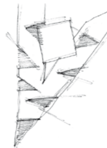
Von der Skizze über die Bauplanung zum umgesetzten Bauprojekt