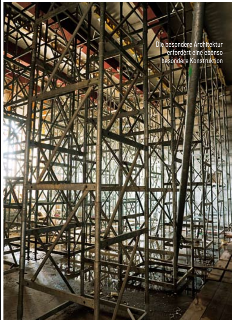
Die besondere Architektur erfordert eine ebenso besondere Konstruktion